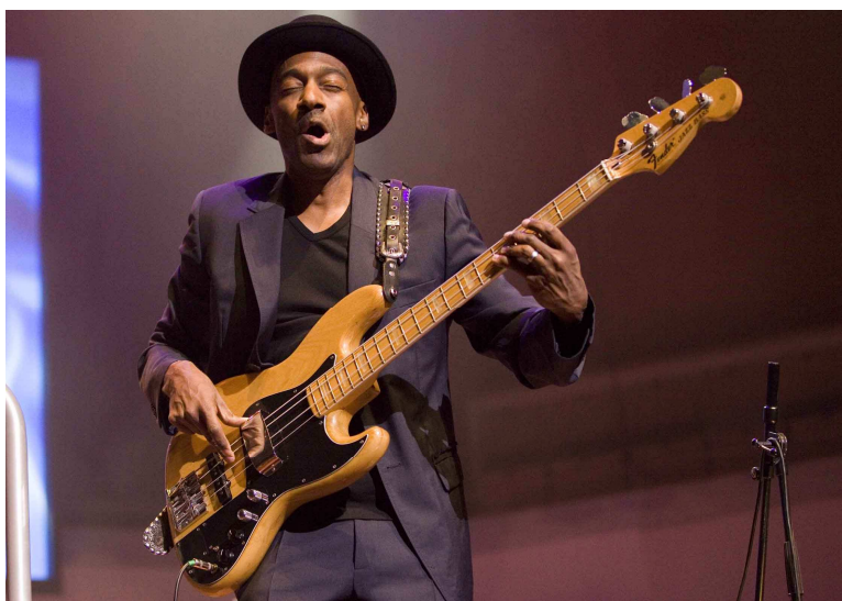
Marcus Miller haalde zijn Edison wel zelf op.

VIER EDISONWINNAARS ALLEEN OP FILM BIJ PRIJSUITREIKING AANWEZIG